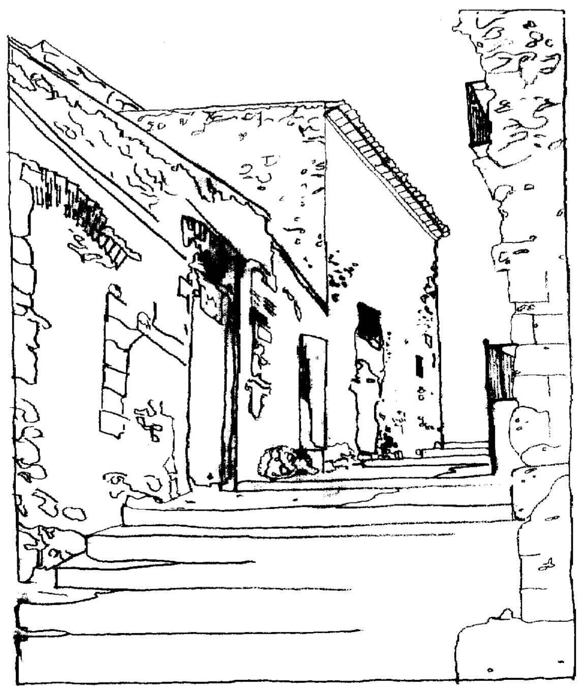
Unità dell'isolato n° 96